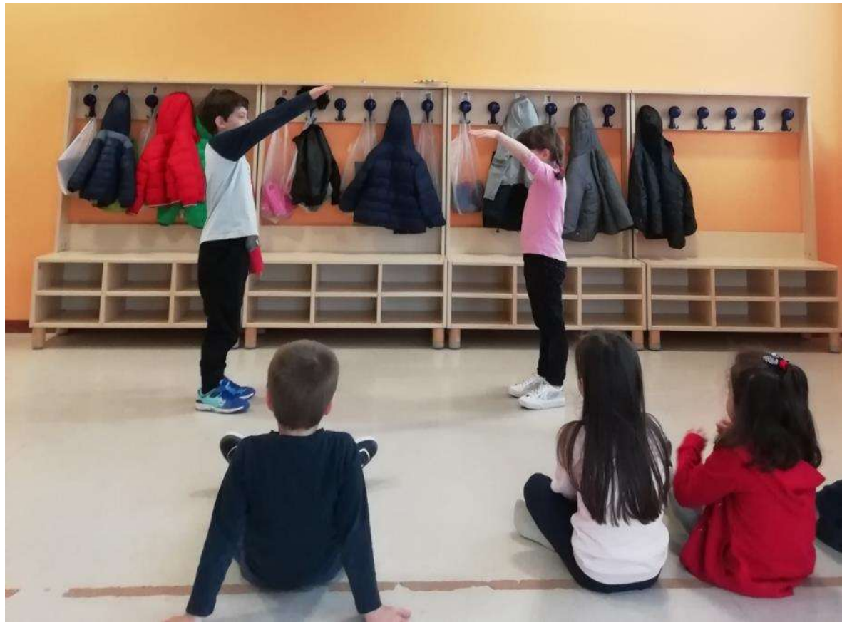
«Il gioco dello specchio»