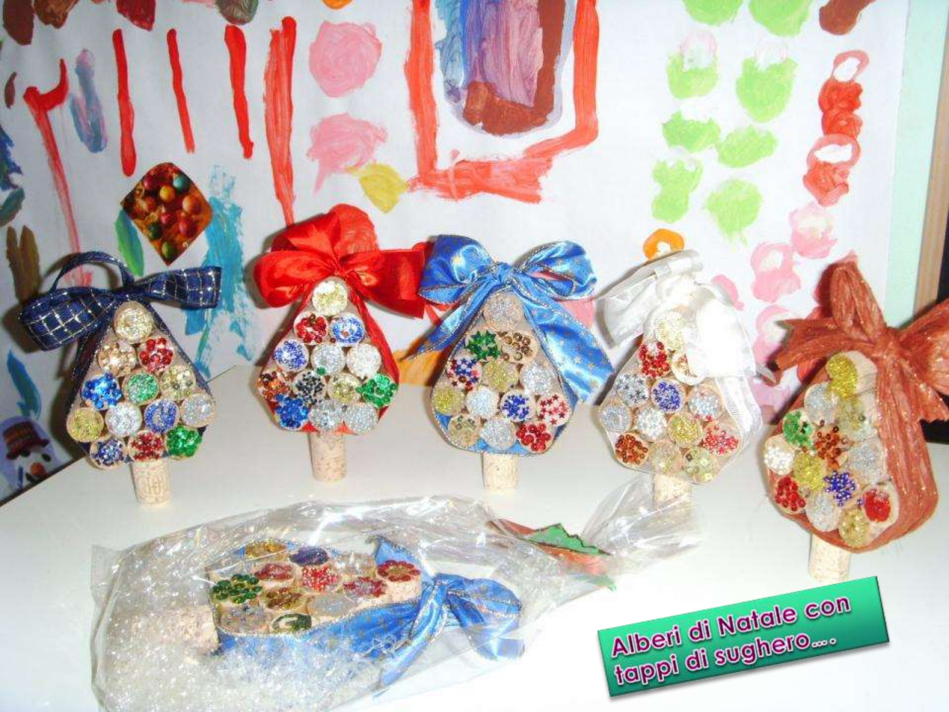
Alberi di Natale con tappi di sughero...