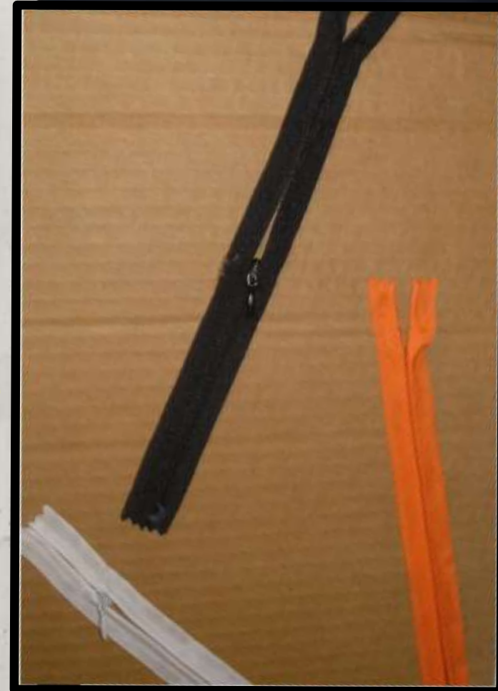
Cartoncino, vecchie cerniere lampo e colla per diventare esperti ad allacciarsi felpe e giacconi...