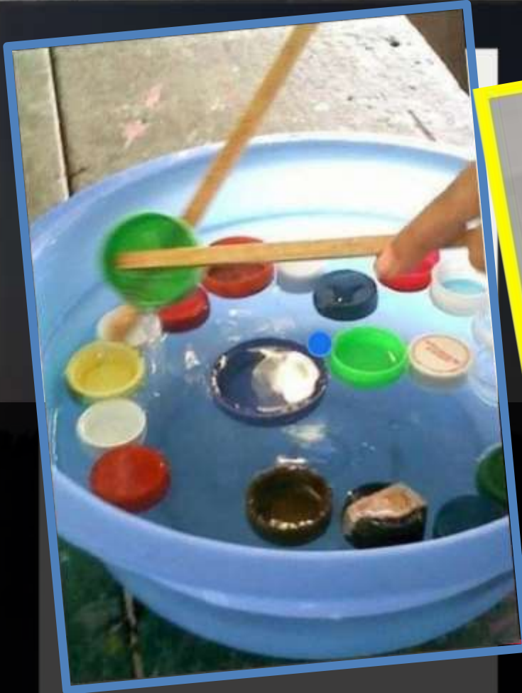
Bacinella, acqua, tappi di plastica, due bastoncini o in alternativa due cucchiai di legno a rovescio