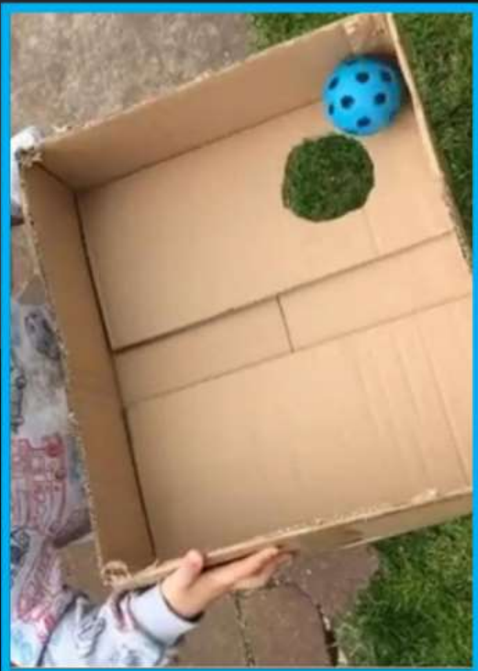
Una vecchia scatola e una pallina