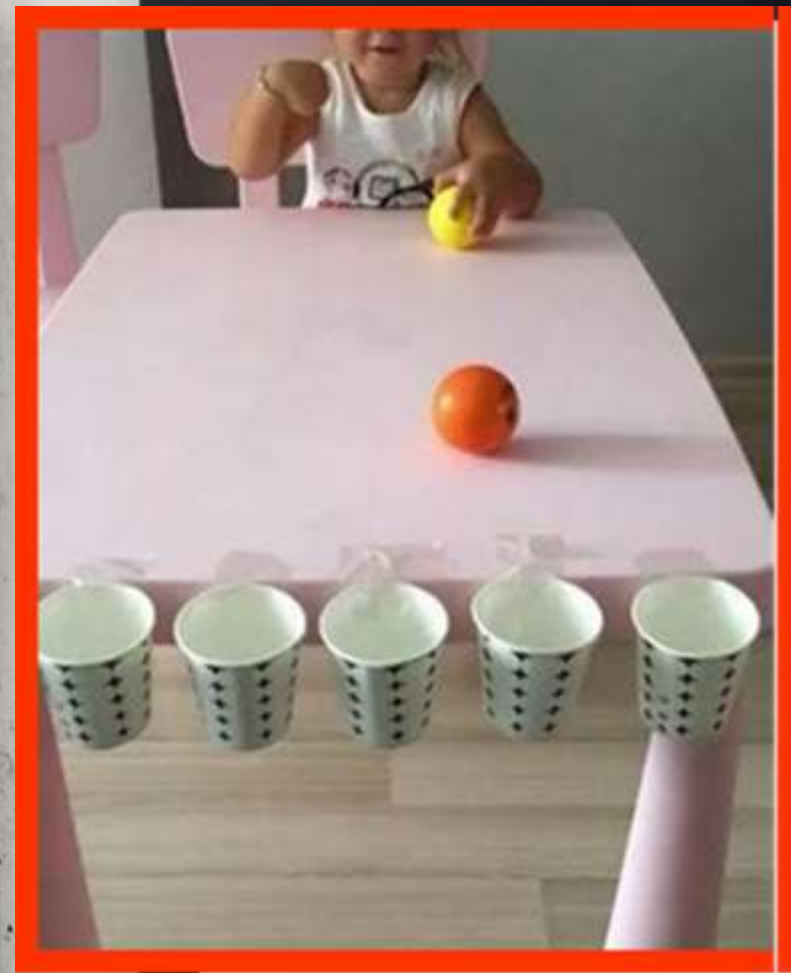
Bicchieri, pallina o qualsiasi altra cosa che possa rotolare...