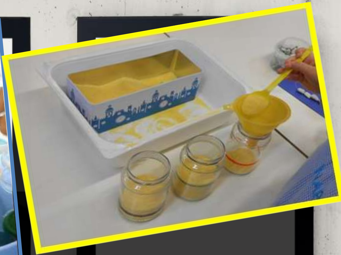
Farina, vecchi barattoli di vetro, imbuto e cucchiaino per travasare