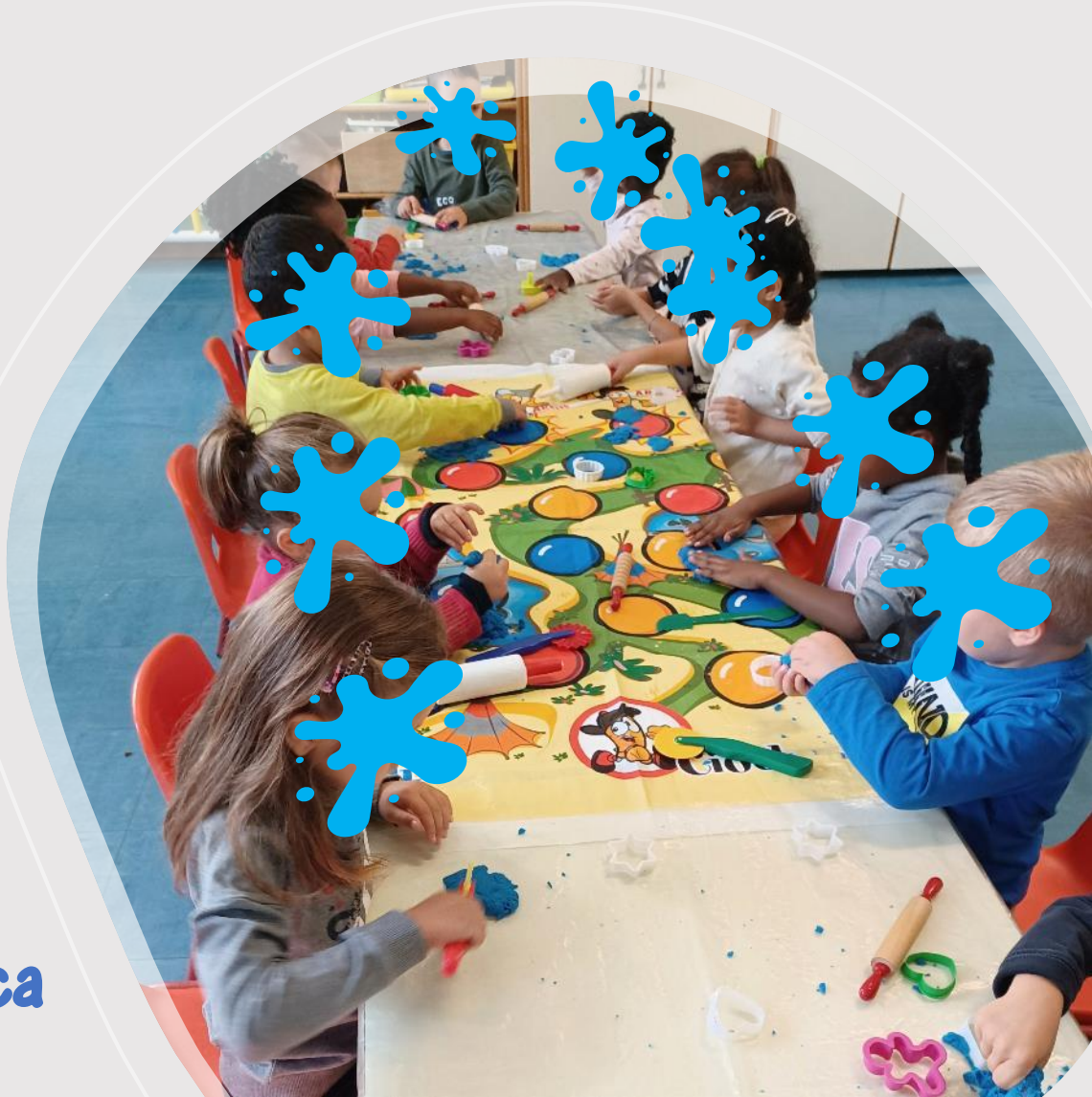
Manipolazione di sabbia cinetica